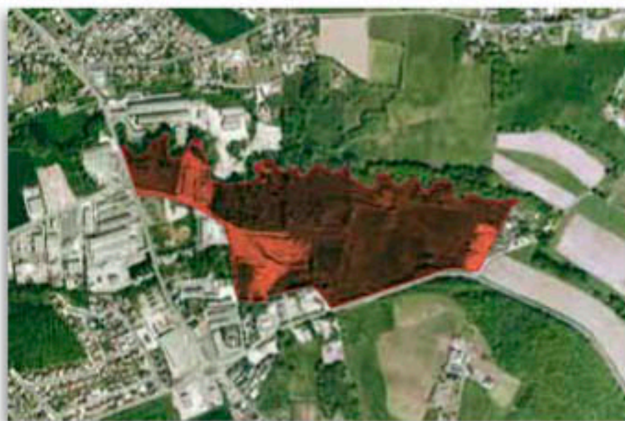
Prise de vue par satellite

La zone sera desservie par une voie principale structurante (largeur circulée : 7 m) reliant l'avenue de l'industrie à la route de Beynat. La sécurité des accès sera assurée avec la réalisation d'un giratoire à chacun des raccordements sur les voiries existantes. Sont prévus des stationnements ( Poids lourds/véhicules légers), des trottoirs, l'éclairage public, des plantations en bordure de voie et le verdissement des accotements non circulés.