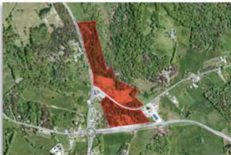
BD ORTHO V2 - IGN PARIS 2004 - REPRODUCTION INTERDITE - LICENCE N° 200605ubco67 Prise de vue par satellite.

La zone sera desservie par une voie principale structurante (largeur circulée : 6 m) reliant la voie communale de Maranzat à la RD 38 (route de Brive) à partir d'un tourne-à-gauche spécialement aménagé à cette occasion. Sont prévus des stationnements (PL/VL), des trottoirs, l'éclairage public, des plantations en bordure de voie et le verdissage des accotements non circulés et le long des zones habitées.