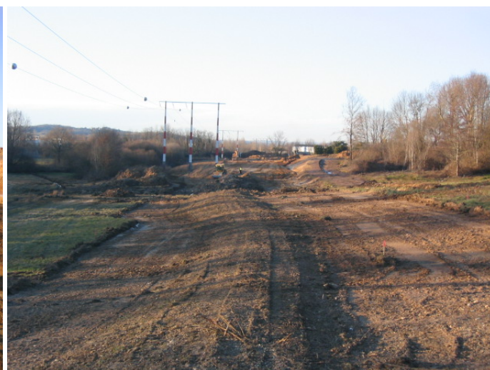
Vue du chantier depuis la RD 59

Entreprises travaillant sur la zone du Fourneault : bureau d'études PÖYRY, entreprises SIORAT, MIANE et VINATIER, EUROVIA, GUINTOLI, FORCLUM, APPIA, ATE