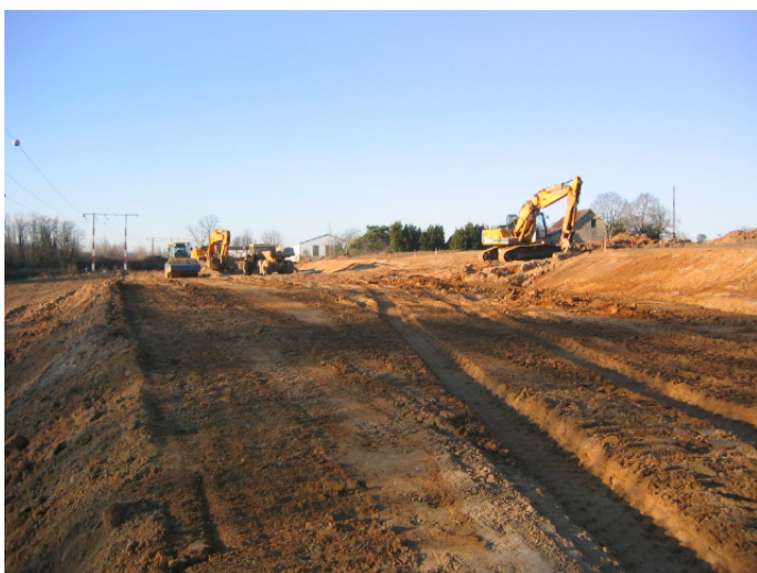
Terrassement en pleine masse